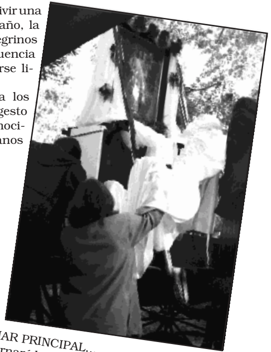
EL AJUAR PRINCIPAL... que adornará la imagen peregrina se comenzó a desplegar varias horas antes de la Procesión. Con todo cuidado se fueron colocando los adornos que embellecían el ícono para su salida solemne.

TODO PREPARADO... para vivir una jornada memorable. Cada año, la Fiesta atrae a miles de peregrinos hasta el Santuario y tal afluencia de público no puede dejarse librada al azar. Se trata de cuidar hasta los mínimos detalles como gesto de amor al Señor y reconocimiento a nuestros hermanos que lo visitan.