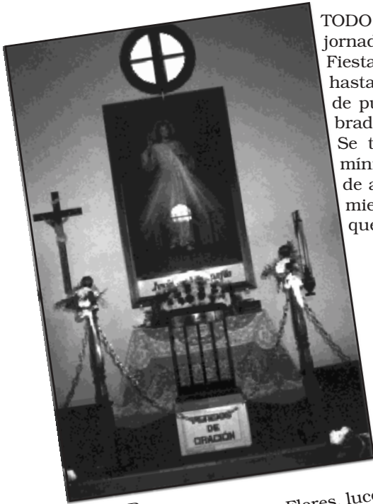
EN EL INTERIOR... del Santuario todo se viste de gala. Flores, luces, incienso. La urna de intenciones invita a pedir con confianza la gracia que tanto necesitamos, allí, a los pies del Señor, Rey de Misericordia.

TODO PREPARADO... para vivir una jornada memorable. Cada año, la Fiesta atrae a miles de peregrinos hasta el Santuario y tal afluencia de público no puede dejarse librada al azar. Se trata de cuidar hasta los mínimos detalles como gesto de amor al Señor y reconocimiento a nuestros hermanos que lo visitan.