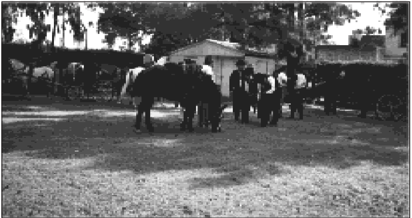
LA AGRUPACIÓN FERMÍN MOLINA... de Berazategui se hizo presente con sus carruajes y gauchos para honrar a Jesús Misericordioso. Su presencia aportó colorido y solemnidad a la Procesión. En la imagen se observan los preparativos previos a la misma