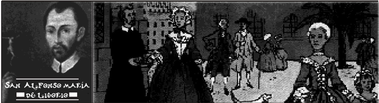
SAN ALFONSO MARÍA DE LIGORIO

Cada día de su vida, Alfonso entra más en el mundo de Dios y se desprende más del materialismo reinante. Sus conocidos lo observan con incredulidad, pensando en que ha perdido por completo la razón. Recorre las calles buscando limosnas. Quienes fueron sus compañeros de correrías son ahora los que lo rechazan y se burlan de él, sin comprender el motivo de su profundo cambio y sin