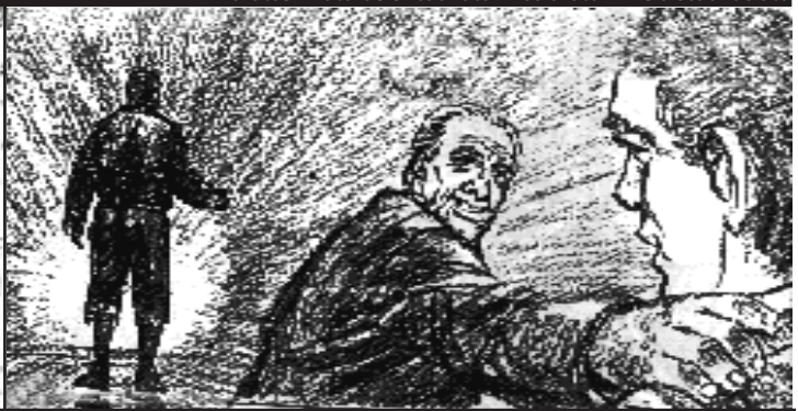
En las manos de la Divina Providencia

En pocos días mas se curó de su enfermedad. Más de cuarenta años después, este lugar se encontrará lleno de postulantes de blancas túnicas, cumpliéndose así la visión premonitoria de Don Orione en su celda. A pesar de haberse sanado, seguía muy débil física-