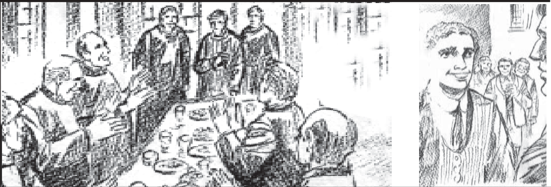
En las manos de la Divina Providencia

El 4 de octubre de 1886, Luis Orione ingresó en el Oratorio de Valdocco, Turín. Estaba radiante. ¡Cuánto amor a Jesús, a María, al Papa, a los jóvenes se demuestra en la Orden!. ¡Qué hermosa fiesta cuando se ordenaban nuevos sacerdotes o partían a misionar en lugares lejanos! Pero sobre todas las cosas,