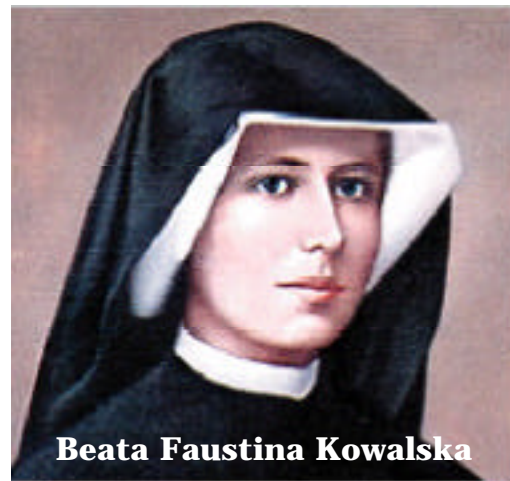
Beata Faustina Kowalska

(Mensajes de Jesús Misericordioso a Sor Faustina Kowalska)