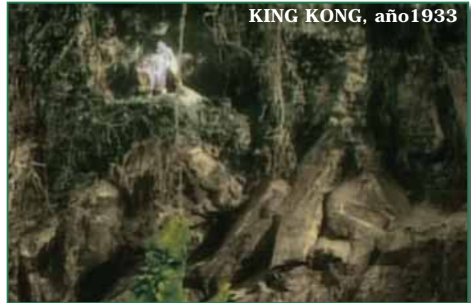
KING KONG, año 1933