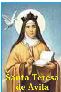
Santa Teresa de Ávila

La paciencia todo lo alcanza;/ quien a Dios tiene/Nada le falta: Sólo Dios basta