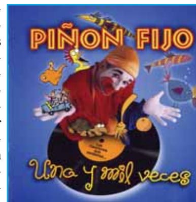
Tapa del CD

Hemos detallado someramente los mensajes ocultos al revés en los temas que Piñón Fijo utilizó para su primera presentación en público. Después de ser descubierto en diversos medios, utilizó la táctica de la desaparición de escena hasta que el público poco atento lo olvidara,