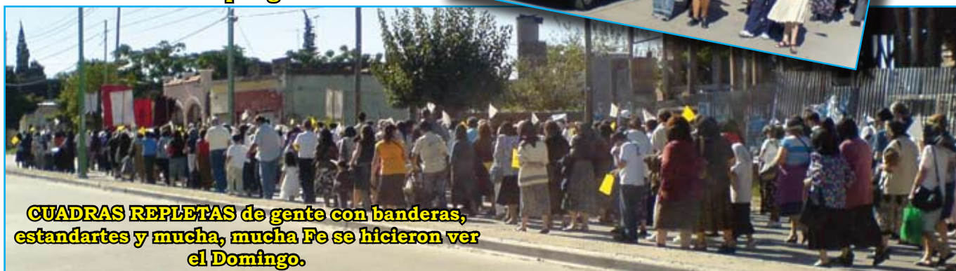
CUADRAS REPLETAS de gente con banderas, estandartes y mucha, mucha Fe se hicieron ver el Domingo.