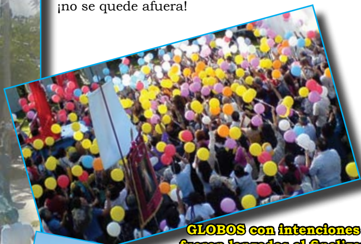
GLOBOS con intenciones fueron lanzados al finalizar la procesión.

¿OTRA vez se lo perdió?... ¡Qué lástima! La Fiesta de la Divina Misericordia volvió a ser el evento católico más importante del año. Paros, cortes de ruta, inseguridad y otros miles de inconvenientes no lograron detener el peregrinar de los devotos que concurrieron al Santuario para alcanzar las gracias prometidas por el Señor a sus fieles. Las imágenes son más que elocuentes y muestran cómo Berazategui fue, una vez más, la CIUDAD DE DIOS. El próximo Retiro Espiritual... ¡no se quede afuera!