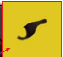
SECTOR DE LA ETIQUETA AMPLIADO Y GIRADO