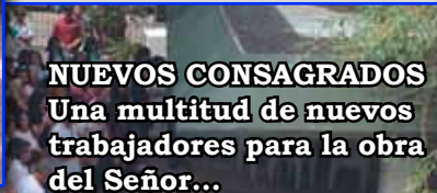
NUEVOS CONSAGRADOS Una multitud de nuevos trabajadores para la obra del Señor...

Este lunes 8 de Diciembre, los devotos de María Santísima le rendimos un fervoroso homenaje, que transformó un feriado silencioso en un día de gloria celestial. La imagen se paseó por las vacías calles de la ciudad derramando invisibles gracias sobre todos, especialmente los más necesitados. Los fieles concurren al Retiro Espiritual organizado por la mañana que culminó con la solemne proce-