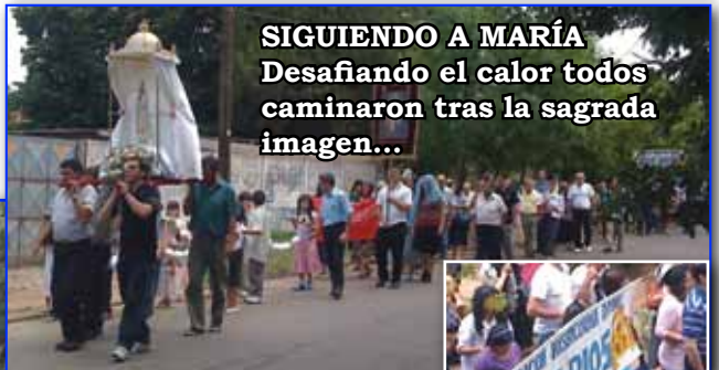
SIGUIENDO A MARÍA Desafiando el calor todos caminaron tras la sagrada imagen...