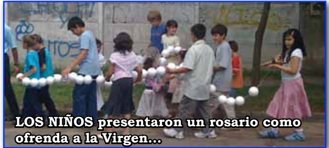
LOS NIÑOS presentaron un rosario como ofrenda a la Virgen...