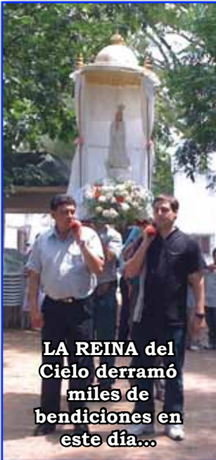
LA REINA del Cielo derramó miles de bendiciones en este día...

Este lunes 8 de Diciembre, los devotos de María Santísima le rendimos un fervoroso homenaje, que transformó un feriado silencioso en un día de gloria celestial. La imagen se paseó por las vacías calles de la ciudad derramando invisibles gracias sobre todos, especialmente los más necesitados. Los fieles concurren al Retiro Espiritual organizado por la mañana que culminó con la solemne proce-