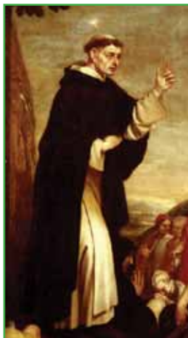
San Vicente Ferrer

Como Dios, el Salvador redimió al mundo con la asistencia de la Virgen. Así será también ahora: a través de María Él salvará al mundo, ahora sumergido en el pantano del pecado, de la merecida aniquilación.