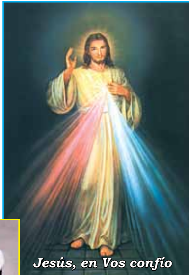
Jesús, en Vos confío

voluntad que deseen ser MISIONEROS DE JESÚS MISERICORDIOSO .