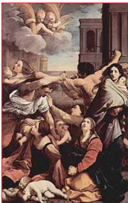
LA MATANZA DE LOS INOCENTES ordenada por Herodes para librarse de Jesús

El historiador judío Flavio Josefo relata así su enfermedad: Se agravaba día a día, castigándole Dios por los crímenes que había cometido. Una especie de fuego lo iba consumiendo lentamente, el cual no sólo se manifestaba por su ardor al tacto, sino que le dolía en el interior. Sentía un vehemente deseo de tomar alimento, lo cual le era imposible; agréguese la ulceración de los intestinos y especialmente un cólico que le ocasionaba terribles dolores; también en los pies estaba afectado por una inflamación con un líquido transparente y sufría un mal igual a éste en el abdomen; además una gangrena en las partes genitales que engendraba gusanos. Cuando estaba de pie se hacía desagradable por su respiración fétida. Finalmente en todos sus miembros experimentaba convulsiones espasmódicas de una violencia insoportable. Decían los que se entregaban al estudio de las ciencias divinas y los aficionados a