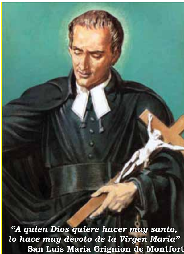
“A quien Dios quiere hacer muy santo, lo hace muy devoto de la Virgen María” San Luis María Grignon de Montfort

rejes jansenistas que decían que no había que recibir casi nunca los sacramentos porque no somos dignos de recibirlos. Con esta teoría tan dañosa enfriaban mucho la fe y la devoción. San Luis decía todo lo contrario y se esforzaba por propagar la frecuente confesión y comunión y una gran devoción a Nuestra Señora: por eso lo perseguían por todas partes. Pero él recordaba muy bien aquellas frases de Jesús: “ El discípulo no es más que su maestro. Si a Mí me han perseguido y me han inventado tantas cosas, así os tratarán a vosotros ”. Y nuestro santo se alegraba porque con las persecuciones se hacía más semejante al Divino Maestro. Antes de ir a regiones peligrosas o a sitios donde mucho se pecaba, rezaba con fervor a la Santísima Virgen, y ¡adelante! que “ donde la Madre de Dios llega, no hay diablo que se resista ”. Las personas que habían sido víctimas de la tentación se quedaban admiradas de la manera tan franca como les hablaba este hombre de Dios. Y la Virgen María se encargaba de conseguir la eficacia para sus predicaciones. San Luis de Montfort fundó unas Comunidades religiosas que han hecho inmenso bien en las almas. Murió el 28 de abril de 1716, a la edad de 43 años, agotado de tanto trabajar por la salvación de la Humanidad y ahora descansa en brazos de su Santísima Madre a quien tanto honró con su vida.