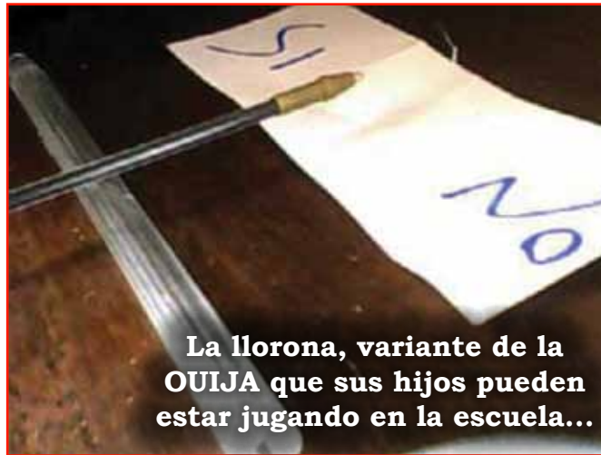
La llorona, variante de la OUIJA que sus hijos pueden estar jugando en la escuela...

Si este testimonio sirve para alguien, tiene mi autorización para publicarlo. Un saludo cordial.