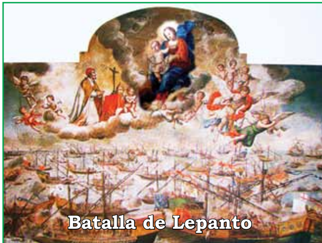
Batalla de Lepanto

nada, cuando los reyes católicos, Fernando e Isabel, pudieron definitivamente expulsar a los moros de la península en 1492. La importancia de esta victoria es incalculable ya que en ese mismo año ocurre el descubrimiento de América y la fe se comienza a propagar por el nuevo continente.