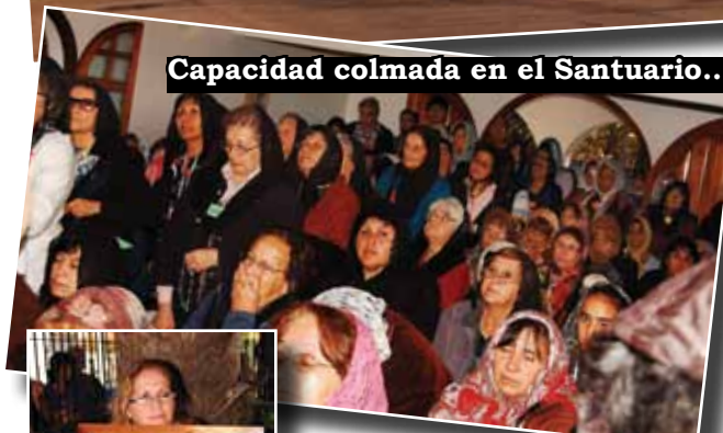
Capacidad colmada en el Santuario...