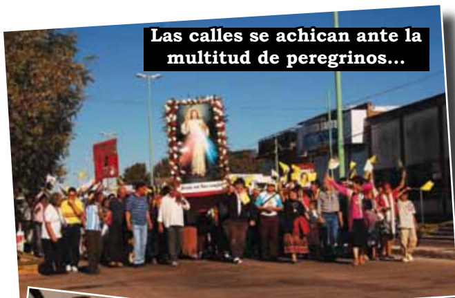
Las calles se achican ante la multitud de peregrinos...

algunas de las imágenes tomadas el día de la fiesta, para advertir que el número de peregrinos creció hasta el triple de la cantidad de participantes del año anterior, lo que demuestra la cada vez más fuerte influencia de Jesús en los corazones de los sinceros devotos que quieren rendirle culto en espíritu y en verdad. Si usted estuvo allí, reviva los momentos y si no concurrió al Santuario... el próximo 27 de mayo el Señor lo espera con los brazos abiertos y las manos llenas de gracias.