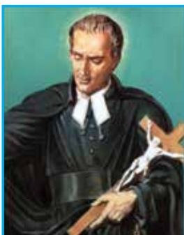
Grignon de Montfort

(Continuación) Para confirmar sus palabras y cegarse aún más, alegan algunos hechos verdaderos o falsos -poco importa que han oído o leído, en los que se asegura que personas muertas en pecado mortal y sin confesión, gracias a que durante su vida habían rezado algunas oraciones o ejercitado algunas prácticas de devoción en honor de la Virgen, resucitaron para confesarse, o su alma permaneció milagrosamente en el cuerpo hasta que lograron confesarse, o a la hora de la muerte obtuvieron de Dios, por la Misericordia de la Santísima Virgen, el perdón y la salvación. ¡Ellos esperan correr la misma suerte! Nada en el cristianismo es tan perjudicial a las gentes como esta presunción diabólica. Porque ¿cómo puede alguien decir con verdad que ama y honra a la Santísima Virgen mientras con sus pecados hiera, traspasa, crucifica y ultraja despiadadamente a Jesucristo, Su Hijo? Si María se obliga-